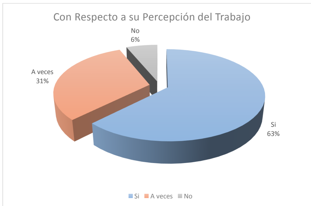
Ilustración 5: Análisis General de la Categoría

Con relación a la categoría sobre su “Percepción del trabajo”, de los 4 profesionales que responden la encuesta, el 63% responde que sí aporta la estrategia de co-docencia para el proceso de enseñanza aprendizaje, consideran adecuado que los estudiantes con NEE no sean sacados al aula de recursos, por otra parte, consideran pertinente que existan horas de colaboración entre los Docente de Enseñanza Básica y la Educadora Diferencial,