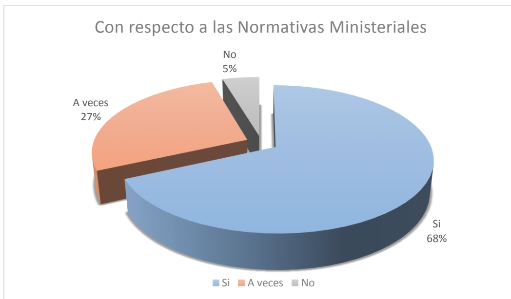
Ilustración 2: Análisis General de la Categoría

Esta categoría, tiene relación con las Normativas Ministeriales, donde las afirmaciones hacen referencias principalmente a Decreto 170, Decreto 83 y las sugerencias de estrategias y tipos de planificaciones que este decreto sugiere para generar un proceso de aprendizaje articulado.