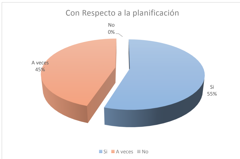
Ilustración 3: Análisis General de la Categoría

En relación a lo analizado en cada pregunta, se identifica que, con respecto al trabajo colaborativo en la planificación, un 55% de los profesionales encuestado responde que sí existe un trabajo de colaboración fuera del aula, considerando las adecuaciones curriculares, aplicando la estrategia de planificar diversificadamente, mientras que el otro 45% solo indica que a veces se realizan estas gestiones dentro de su quehacer pedagógico.