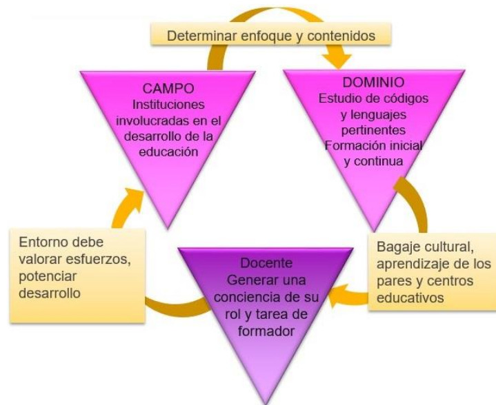
Figura 3. Adaptación docente del Modelo de M. Csikszentmihalyi (1988)

de educación, municipios, etc.) hasta las realidades locales como las corporaciones de educación, liceos y colegios. El trabajo del/la docente talentoso se manifiesta en que es capaz de generar conciencia respecto de su rol y valorar su tarea como formador, como guía, como generador de situaciones de aprendizaje que logren influir en los/las estudiantes, pues el alto desempeño depende tanto de la motivación como de las destrezas docentes, además el entorno educativo es capaz de recoger sus esfuerzos, valorarlos y potenciar su desarrollo personal y profesional en favor del logro de los aprendizajes de los/las estudiantes que son motor de toda la acción educativa.