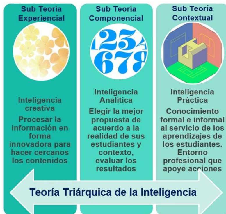
Figura 4. Adaptación docente del Modelo de Robert Sternberg (1985)

la realidad. En el caso de un/a docente es fundamental la expresión de los dos tipos de conocimiento que describe el autor, el conocimiento formal adquirido en la enseñanza profesional y el conocimiento informal que se adquiere en el ejercicio docente y que implica un período de tiempo de preparación además de contar con un entorno profesional que facilite y comparta este conocimiento. Ambos tipos de conocimientos son imprescindibles ya que permiten adaptarse al entorno para ayudar al profesor a innovar en su dominio.