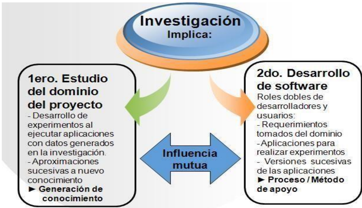
Figura 1: Contexto del problema a solucionar.

Gráficamente lo planteado se puede resumir en la siguiente figura: