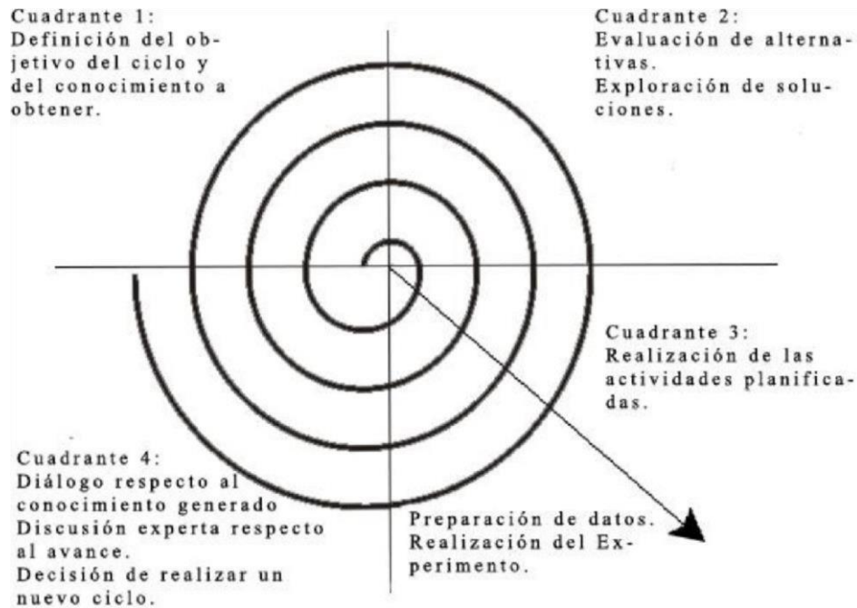
Figura 5: Modelo propuesto en espiral. Fuente: adaptado de Sommerville, 2011.

Cerda Neumann, G. y Antillanca Espina, H. (Julio-Agosto 2017). Presentación del Método KDDP para la creación de Software de Investigación. Revista Akadèmeia , 16 (1), 131-168.